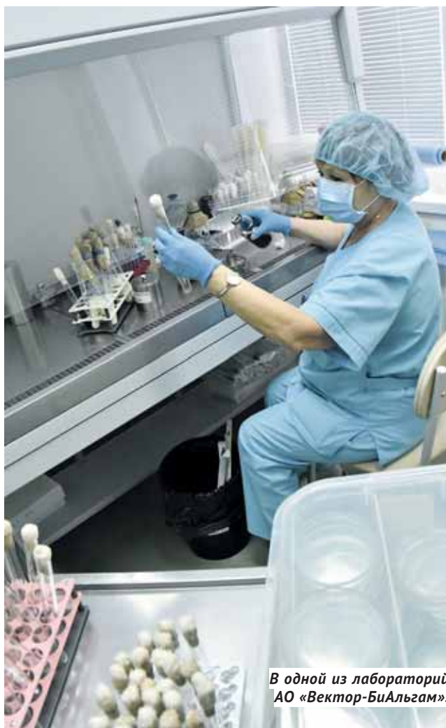
В одной из лабораторий АО «Вектор-БиАльгам».

Сейчас в «Вектор-БиАльгаме» трудится около 200 человек. Коллектив другого предприятия, разместившегося на площадках «Вектора», АО «Вектор-Бест», в четыре раза больше. Эта компания — крупнейший в России производитель наборов реагентов для диагностики заболеваний человека с помощью иммуноферментного анализа и других методов. ВИЧ-инфекция, вирусные гепатиты, лихорадка — крымская и Западного Нила, герпесные инфекции, туберкулёз, желудочно-кишечные и сердечно-сосудистые заболевания — все эти и другие угрозы здоровью позволяет своевременно выявлять продукция «Вектор-Беста» (а это более 600 наименований реагентов).