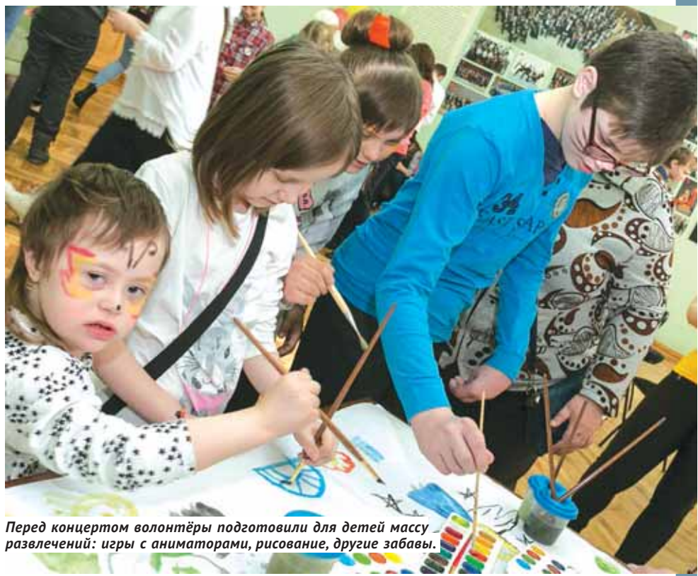
Перед концертом волонтеры подготовили для детей массу развлечений: игры с аниматорами, рисование, другие забавы.

Столько детских улыбок, ни на что не похожих и по-особенному обаятельных, стены Дома Ленина вряд ли видели когда-нибудь раньше. Перед концертом для солнечных детей волонтеры подготовили массу развлечений: игры с аниматорами, рисование, другие забавы. Наблюдая за увлечёнными ребятами, порой было трудно поверить в то, что эти дети развиваются не так, как большинство их сверстников. Многим из них общество «ДАУН СИНДРОМ» помогает едва ли не с момента рождения.