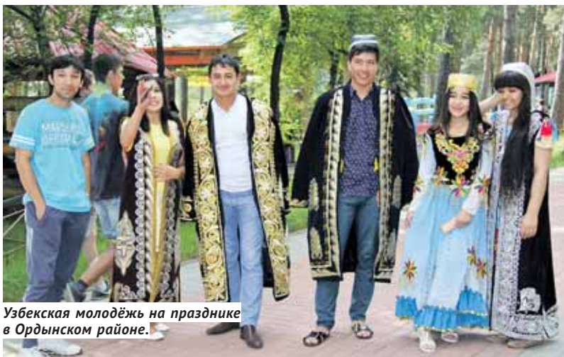
Узбекская молодёжь на празднике в Ордынском районе.