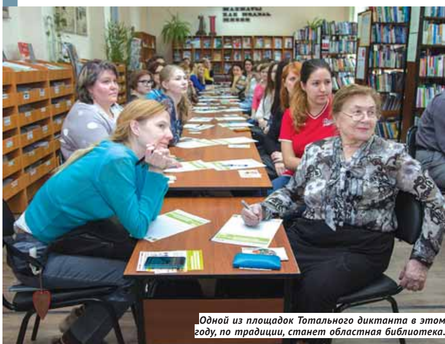
Одной из площадок Тотального диктанта в этом году, по традиции, станет областная библиотека.

В ближайшую субботу, 8 апреля, новосибирцы вместе с жителями многих других городов и стран узнают, насколько они грамотны, в ходе очередной акции Тотальный диктант.