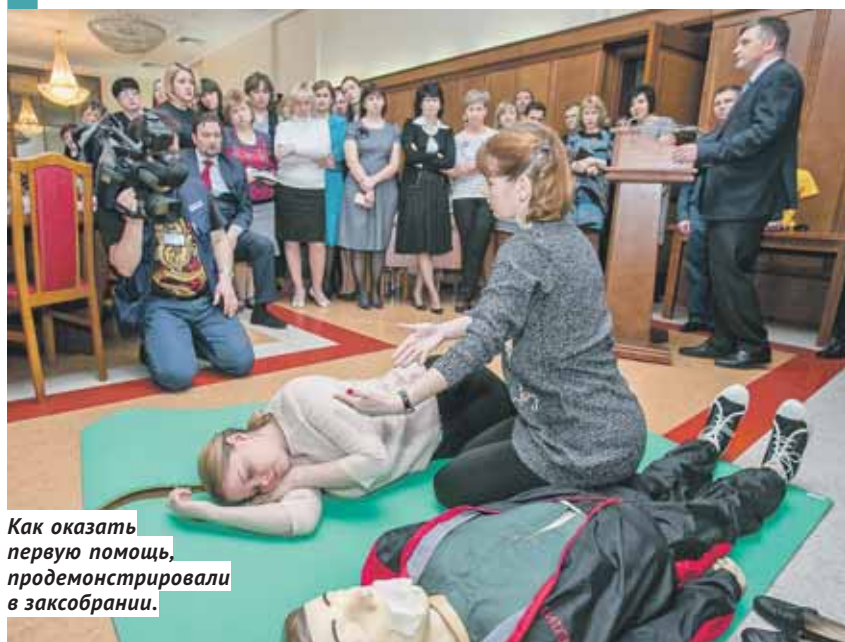
Как оказать первую помощь, продемонстрировали в заксобрании.